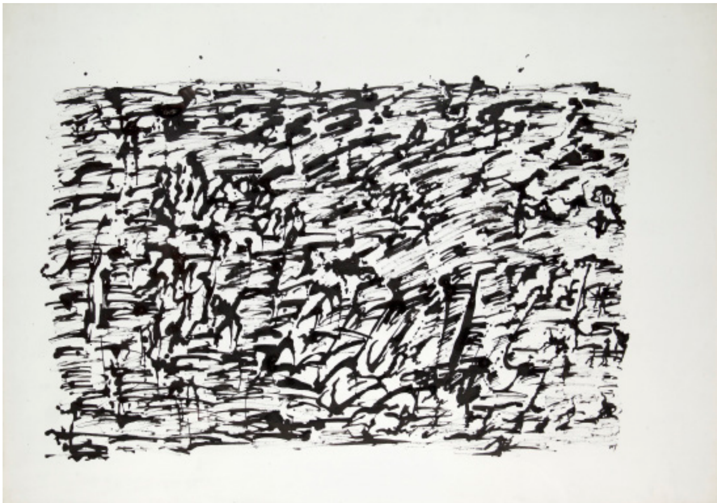
Henri Michaux Circa 1965 Encre de Chine sur papier 74 x 108 cm