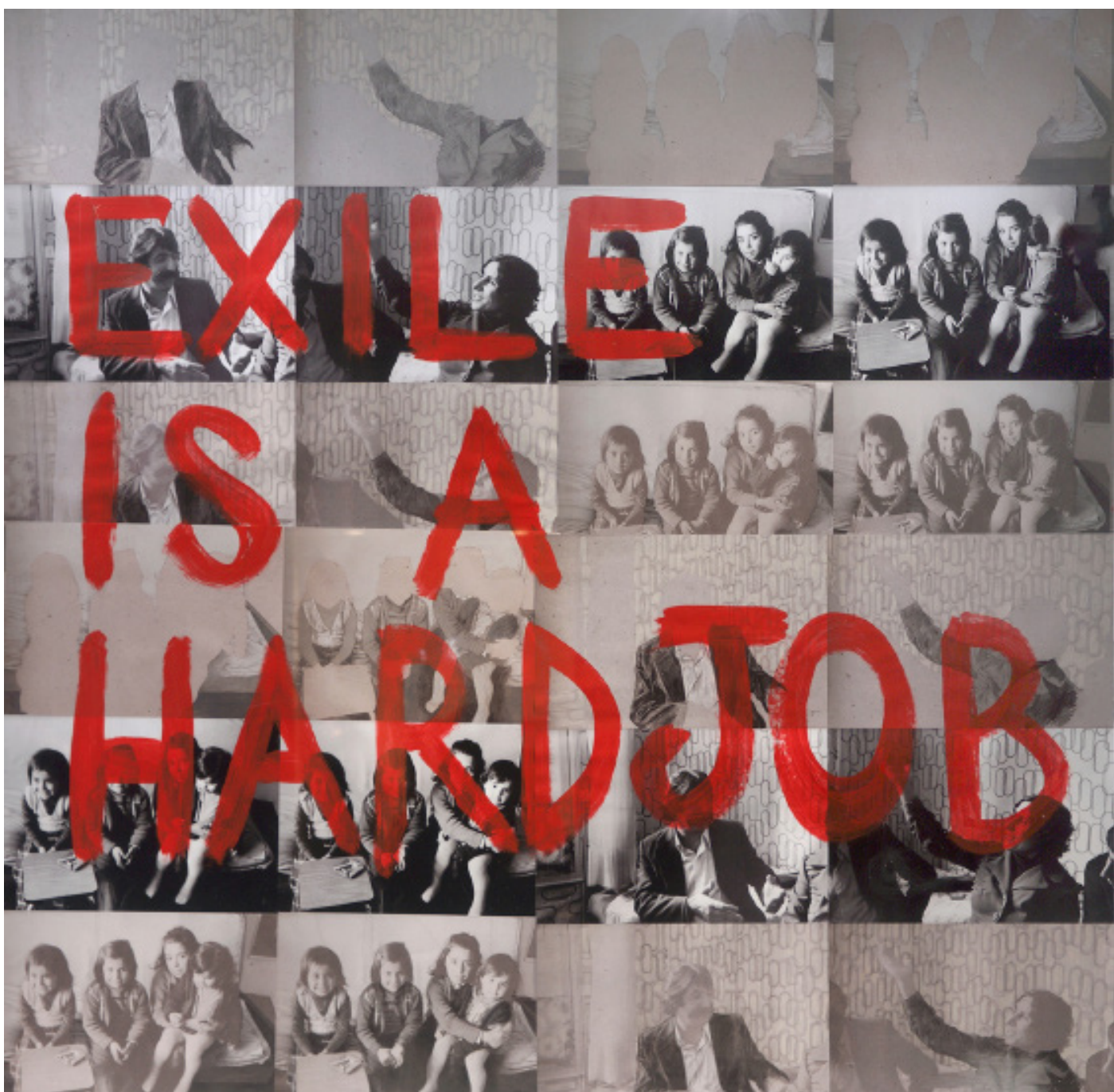
Nil Yalter Exile is a hard job, 1974-maintenant Peinture sur affiches contrcollées sur Dibond 160 x 160 cm