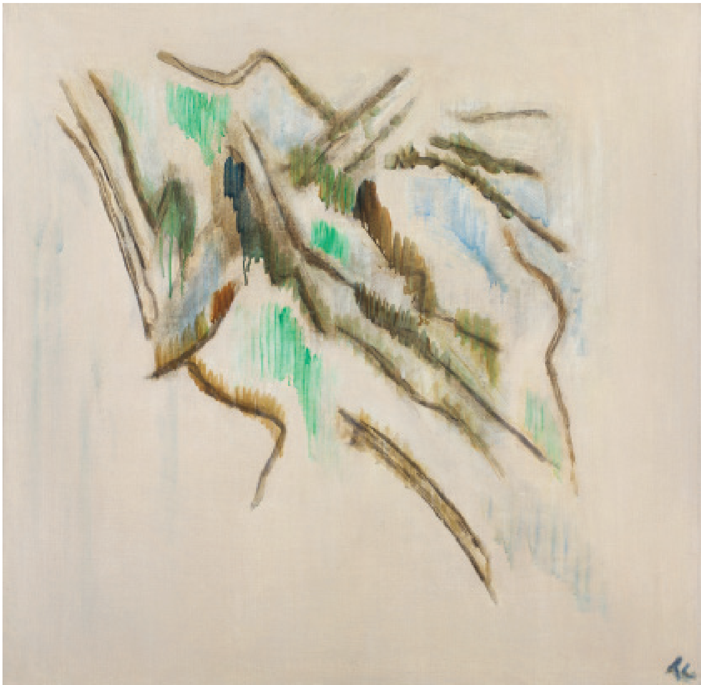
Pierre Tal Coat Le rocher vert , 1950 Huile sur toile 78 x 78 cm