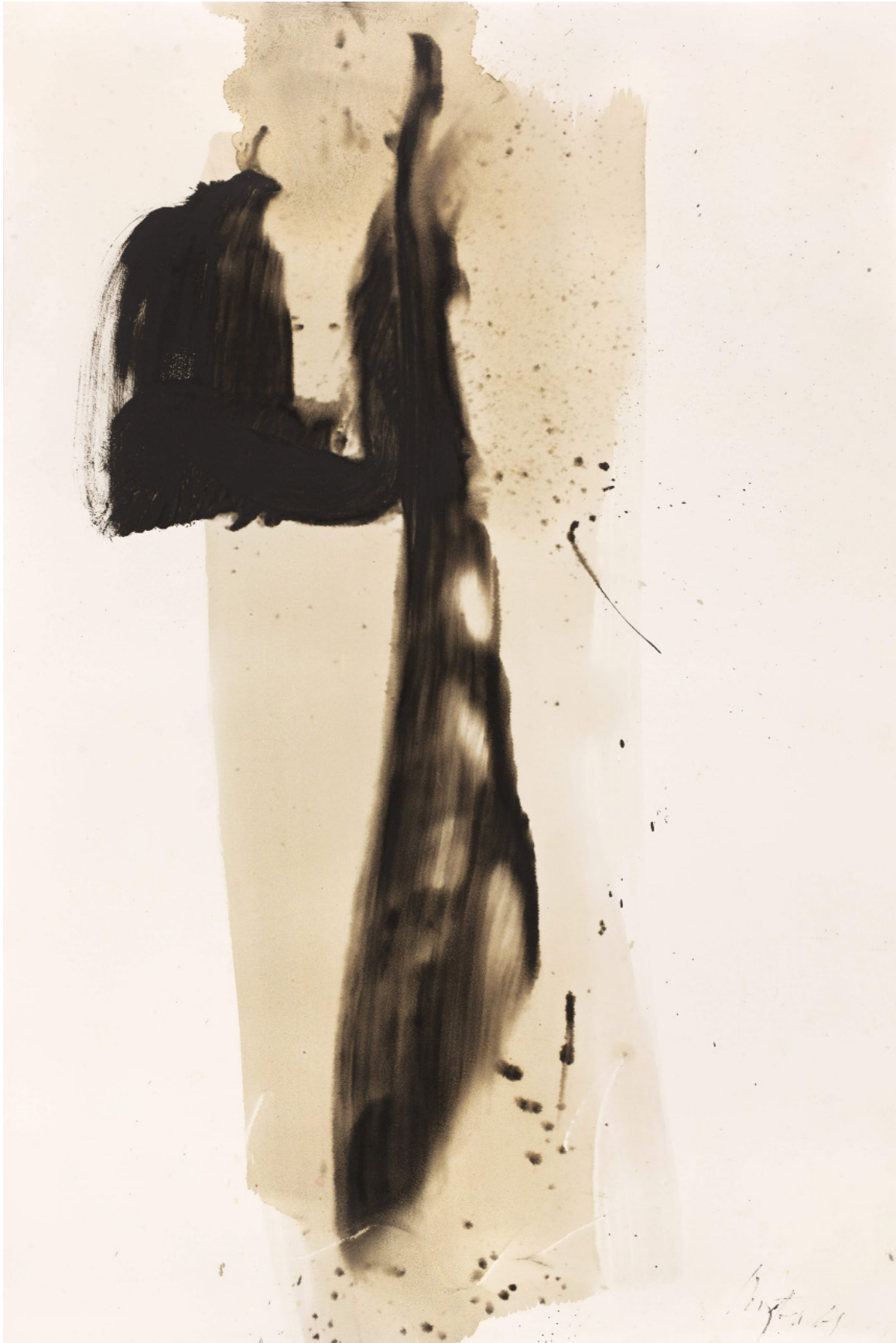
Jean Degottex Myo II , 1961 Huile sur carton marouflé sur toile 120 x 80 cm