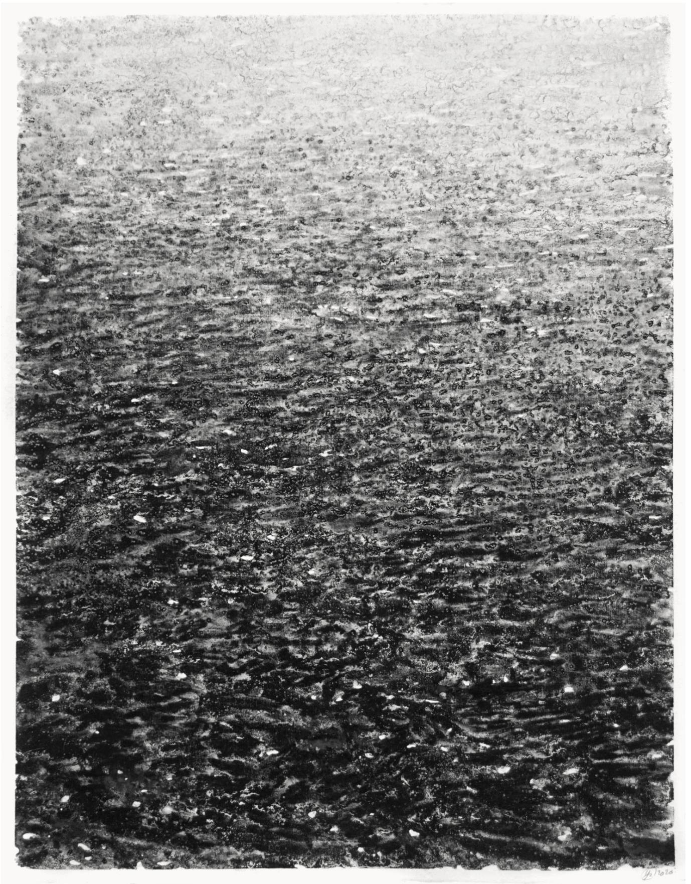
Yann Bagot Myriades #26.45, 2026 Encre de Chine, eau de mer et sel sur papier 46 x 36 cm