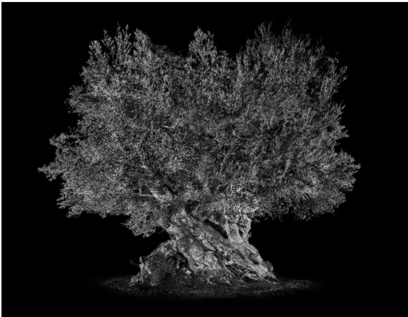
Antoine Schneck Giuseppe , tirage sur 8 Photographie, tirage pigmentaire sur papier contrecollé sur Dibond 100 x 120 cm