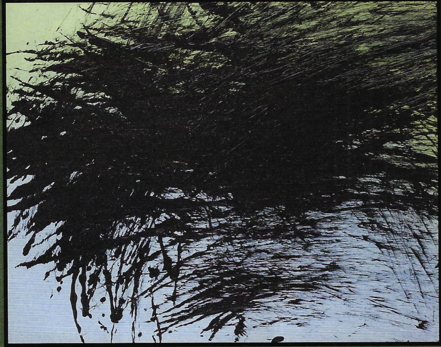
Hans Hartung, T1982-K40, 1982

On le connaît pour ses grandes peintures abstraites qui signent le geste de l'artiste comme de longues griffures déchirant la toile blanche. Nommé le « peintre des éclairs », Hans Hartung est l'un des pionniers de l'abstraction lyrique aux côtés de Gérard Schneider et Pierre Soulages.